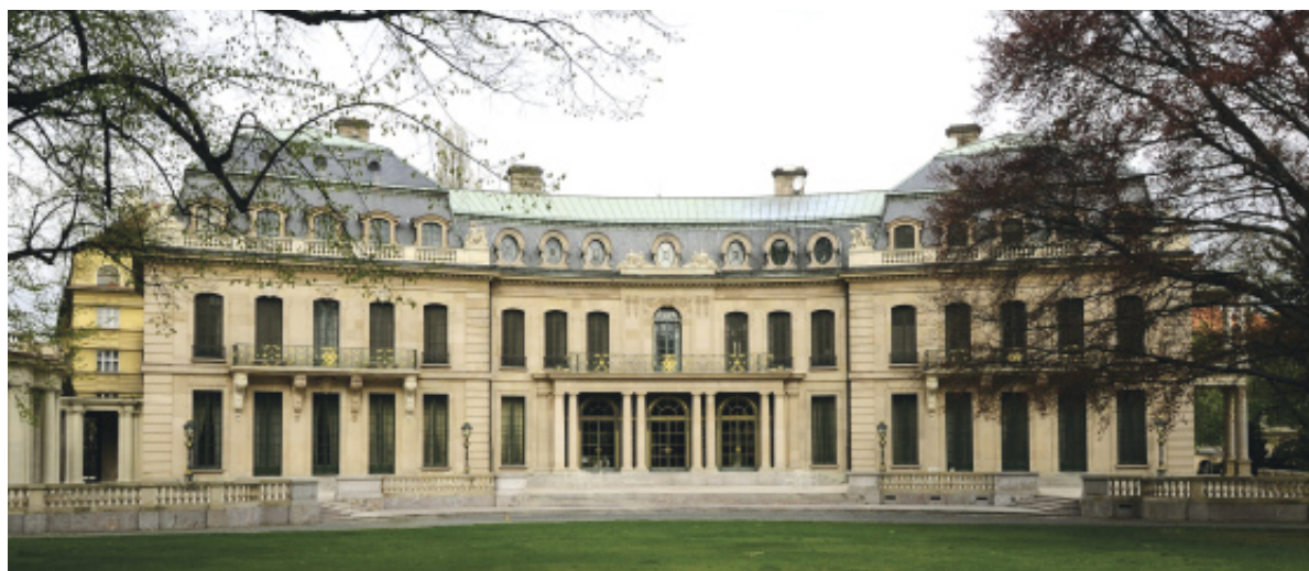
Vila Otto Petschka, rezidence velvyslance USA