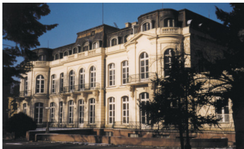
Nové sídlo PNP, bývalá Petschkova vila